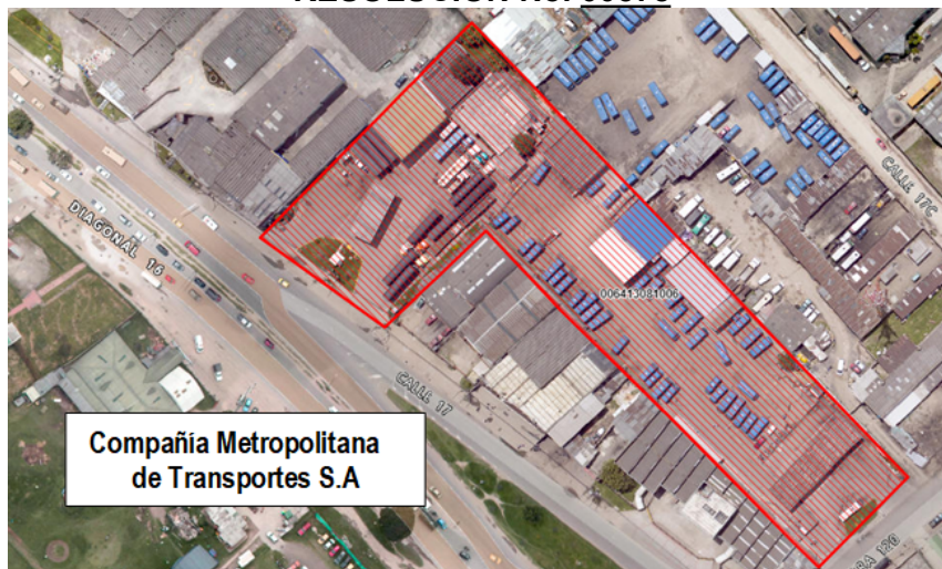
Imagen No. 2. Ubicación del pozo profundo pz-09-0004.